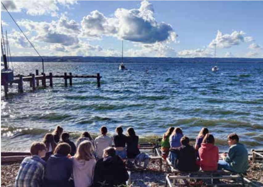
Konfiwochenende am Ammersee.